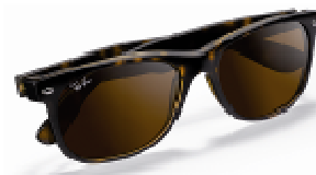
Un modèle Ray-Ban®

Les packs solaires sont également disponibles pour tous ceux et celles qui souhaitent renouveler leurs lunettes de vue (sans la protection solaire).*