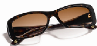
Un modèle Vogue